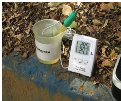
Figuras 4 e 5. Coleta de amostras e análise de parâmetros físicos na ETE Coqueiros, Santíssimo, RJ.

Constata-se que boa parte dos efluentes do tratamento secundário das ETE avaliadas já atenderia vários padrões da legislação adotada como referência, em especial os da United States Environmental Protection Agency (USEPA) para uso restrito, sem necessidade de agregar etapas de polimento e/ou pós-tratamento para sua adequação.