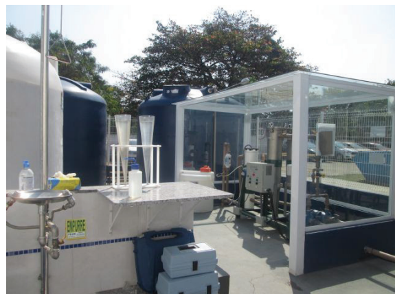
Figura 2. Sistema de produção de água de reuso na ETE Deodoro.