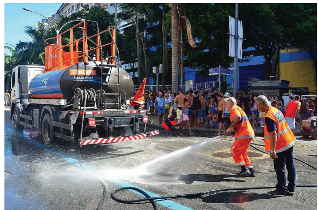
Figura 1. Lavagem de via pública com água de reuso no centro do RJ.

Na ETE Deodoro, a água de reuso é proveniente de projeto piloto com capacidade para 240m 3 /dia e reservação de 40m 3 que funciona desde 2015, composto por filtração por pressão em membrana simples, seguida de cloração (Figura 2). As águas regeneradas são utilizadas pela própria empresa somente para destinações não potáveis e menos nobres como na desobstrução de redes, lavagem de equipamentos, execução de redes por métodos não destrutivos e na diminuição do material particulado, através da umectação em locais de obras para assentamento de redes (Grupo Águas do Brasil, 2015; Pieroni, 2016).